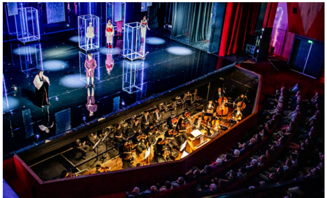
Samen met onze partner Opera Zuid maken we ambitieuze operaproducties.

Het Activiteitenplan is zodanig vormgegeven dat er ruimte blijft om in te spelen op actuele ontwikkelingen. In tegenstelling tot eerdere businessplannen van philharmonie zuidnederland wordt in dit Activiteitenplan niet alles voor de komende vier jaar vastgelegd. U leest het volledige Activiteitenplan in de bijlage van dit Businessplan.