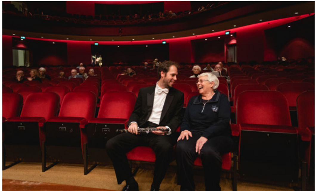
We zijn allemaal aanspreekbaar door eigenaarschap .