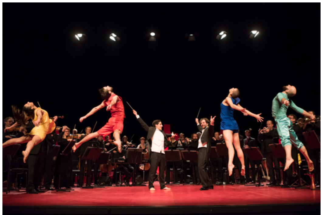
HeartBeat : educatie waar je hart sneller van gaat kloppen. Gemaakt voor de doelgroep 10-14 jaar door philharmonie zuidnederland in samenwerking met Sally Dansgezelschap Maastricht en Kunstloc Brabant.

Dat kan naar aanleiding van een muzikale voorstelling maar kan ook door uitdagende opdrachten in het lesmateriaal, waarbij het orkest vaak verbinding legt met andere disciplines. Participatie verhoogt het gevoel van betrokkenheid bij de voorstelling en vormt een element van betekenis, maar staat het luisteren naar de muziek niet in de weg. Een belangrijke rol is weggelegd voor de musici van het orkest: zij zijn de ambassadeurs van de muziek en hebben daarom een cruciale rol in de projecten. Het orkest speelt zowel symfonische educatieconcerten in zalen als ensembleconcerten op scholen en is daarmee in het hele speelgebied bereikbaar voor scholen.