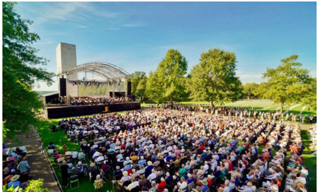
Op 15 september 2019 ontroerden we 6.400 bezoekers met de uitvoering van de Tweede Symfonie van Mahler tijdens het Liberation Concert op de Amerikaanse begraafplaats in Margraten ter gelegenheid van 75 jaar vrijheid.

philharmonie zuidnederland stelt het op prijs wanneer ook de subsidiërende overheden in het licht van dit inzicht aansluiten bij een soortgelijke beoordelingssystematiek.